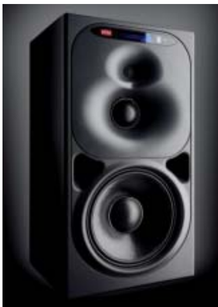
Mit 80 Litern Hubraum und erlesenen Bauteilen bestückt zeigt sich der imposante Midfield-Monitor O 500 C.

Entstanden ist ein aktiver Dreiwegen-Monitor, der über einen Digitalcontroller mit integrierten FIR-Filtern entzerrt und damit optimal auf den jeweiligen Raum angepasst werden kann. Allerdings ist die erste Hürde beim Erwerb nicht allein der Preis von rund 30.000 Euro für das komplette System (je zwei O 500 C, O 900 Subwoofer und PRO A 2000 Endstufen), sondern auch der Platz. Denn das K+H-Paradestück ist von beeindruckenden Dimensionen (siehe auch Seite 110). Doch es sind nicht allein die Maße, die staunen machen; die Entwicklung strotzt überdies vor Besonderheiten: Die Schallführung ist durch die Wave-Guides der einzelnen Chassis maximal optimiert, ein aufwändiges digitales Signalmanagement und ein Werkstoff namens LRIM sollen dafür sorgen, dass die O 500 C klamglich neue Maßstäbe unter den Studiomonitoren setzen.