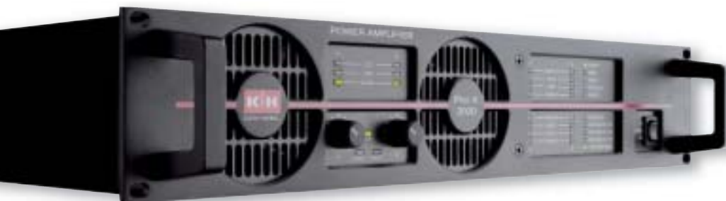
Die Stereo-Hochleistungs-Endstufe Pro A 2000 verfügt über umfangreiche Steuer- und Diagnoseanzeigen und gebrückt über 2.100 Watt bei 4 Ohm.

Hinter einem Gitter am Grund des kleinen Ovals verborgen, liegt die Titan-Gewebe-Kalotte des Hochtöners: bereit, auch bei hohen Leistungen nur geringe Verzerrungen zuzulassen. Bei der Konzeption der Schallwand mit den integrierten Schallführungselementen haben Wolff und sein Team von vorne herein berücksichtigt, dass das Lautsprecher-System über den Digitalcontroller sowohl in Bezug auf den Amplituden- als auch Phasenverlauf zusätzlich entzerrt wird. Mögliche Wechselwirkungen der Lage der einzelnen Chassis und deren Wave-Guides zueinander und daraus resultierende Interferenzen konnten vernachlässigt werden, so dass zunächst nur das Abstrahlverhalten und die Ankopplung der Chassis an das Luftvolumen der Schallführungselemente zur Perfektion gebracht wurde. Das Problem: Große Lautsprecher-Membranen bündeln das abgegebene Signal bei steigender Frequenz zunehmend. Der Abstrahlwinkel eines Tieftöners bei seiner oberen Trennfrequenz ist deutlich verengt, wo hinge-