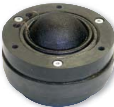
Ungewöhnlich in dieser Größe ist der Kalottentreiber des Mittelton-Chassis: Aber der Klirrfaktor ist im Gegensatz zu Konus-Konstruktionen deutlich reduziert.

Seien es falsche Mikrofonwahl oder unglücklich eingesetzte Effekte: Tatsache ist, die Stimme von Sting klingt kaum erträglich, Alanis Morissettes Intonation lässt stark zu wünschen übrig und Claptons „Tears in Heaven“ klingt grundsätzlich gut und ausgeglichen, aber der Gesang ist leicht aus dem Stereozentrum verschoben: Wer hat denn da nicht aufgepasst? Dass es auch anders geht, zelebriert „Mrs. Robinson“ von Paul Simon. Hier zeigt sich die Klasse sowohl des Musikers, als auch der Techniker: So sollen Live-Aufnahmen klingen. Ehrlich,