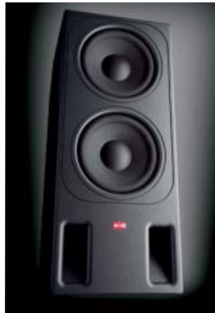
Das souveräne Impulsverhalten wird durch die Subwoofer O 900 noch einmal gesteigert, so dass auch sehr hohe Lautstärkepegel gefahren werden können.

Die beiden Pro A 200-Endstufen versorgen die passiven Subwoofer übrigens mit einer Sinusleistung von bis zu 2.200 Watt in gebrücktem Zustand. Außer hohen Leistungsreserven sorgt dies auch für Betriebssicherheit. Die Entwickler versahen die beiden Kraftwerke mit umfangreichen Steuer- und Diagnosean-