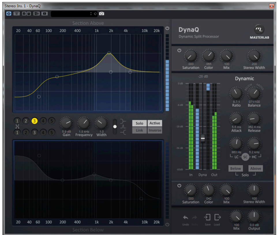
Abbildung 3: Above-Equalizer Band 3 im Solo

fahren. Was man mit den EQs in Above und Below veranstaltet, ist funktional unabhängig voneinander. DynaQ bietet aber zusätzlich die Möglichkeit, die Bänder in beiden Bereichen zu koppeln (Link) oder invertiert zu verbinden (Inverse). Bei letzterer Betriebsart werden Frequenz und Güte der beiden Filter gleich eingestellt, während Gain mit umgekehrtem Vorzeichen angewendet wird. So lassen sich Elemente zum Beispiel noch deutlicher aus ihrem Hintergrund abheben. Spannend (aber wirklich eine Herausforderung) ist diese Anwendung zum Beispiel, wenn eine etwas untergegangene Gesangsphrase betont werden soll. Hilfreich ist die im Band vorgesehene Solo-Funktion, mit der die Filtereinstellungen noch leichter von der Hand gehen (Abbildung 3). Schön ist auch, dass man die Solos der Bänder addieren kann, wobei dann eine globale „Solo Off“ Taste noch eine kleine praktische Hilfe wäre. Apropos praktische Hilfen; man sollte unbe-