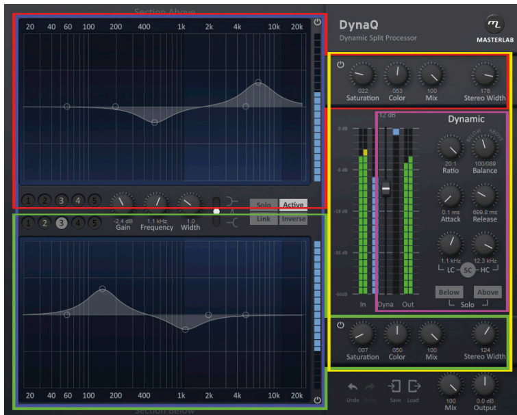
Abbildung 1: Das Plug-In mit seinen Funktionsbereichen: Equalizer (blau), Processing (gelb), Above (rot), Below (grün) und der Dynamiktrennung (pink)